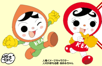
人権イメージキャラクター 人KENまる君・KENまるちゃん