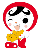
人権イメージキャラクター 人KENまる君

主催 名古屋法務局・愛知県人権擁護委員連合会 株式会社中日新聞社・愛知人権啓発ネットワーク協議会 後援 愛知県教育委員会・愛知県内各市町村教育委員会 協賛 株式会社名鉄百貨店・株式会社名古屋グランパスエイト