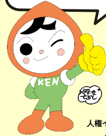
人権イメージキャラクター 人KENまる君